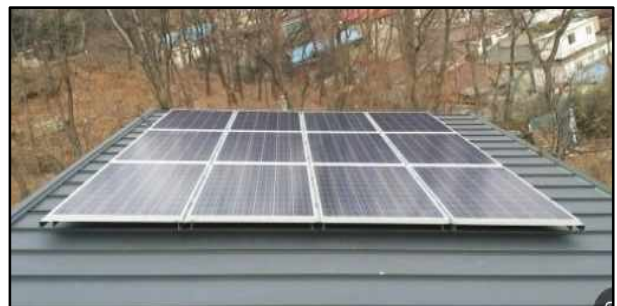
< 설 치 사 례 >