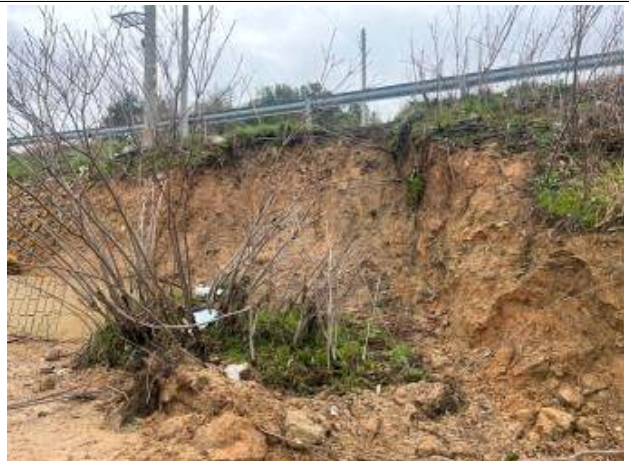
화전리 도로 비탈면 유실