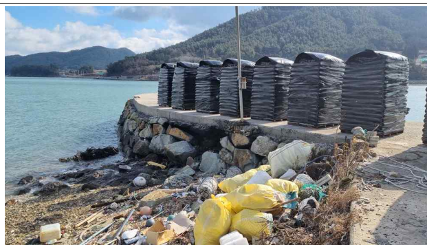
호안도로 사석 유실