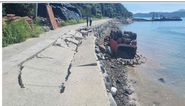
'23. 8. 충도 차량 전복 사례