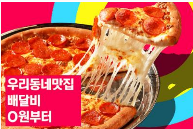
동네 맛집 배달 활성화