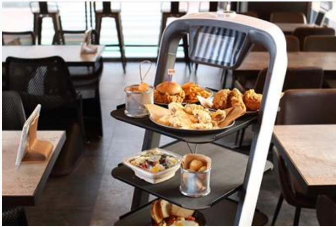
비대면 서빙 로봇