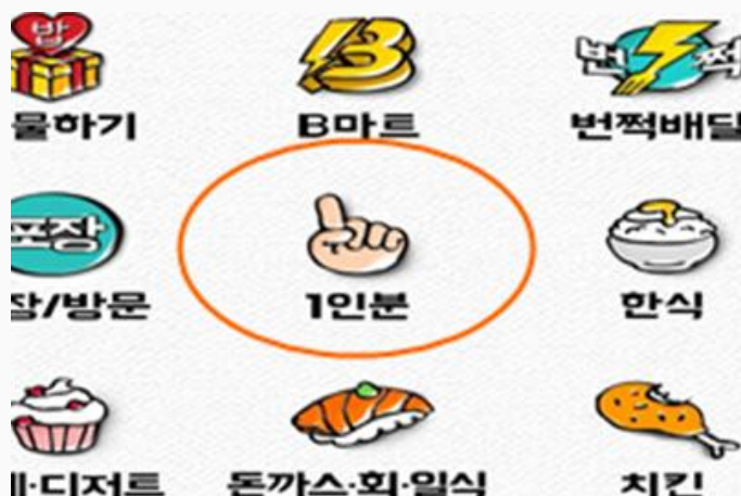
배달앱 1인분 카테고리 (배달의 민족, 요기요 등)