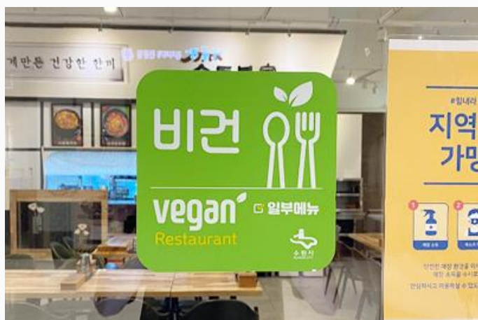
수원시 비건식당 선정