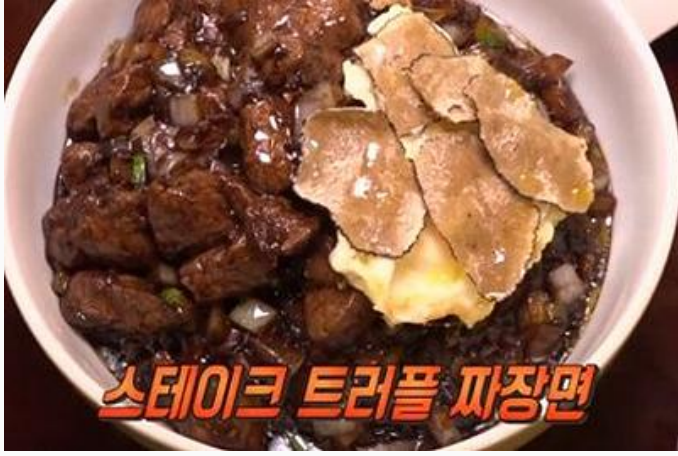
모디슈머 메뉴 (스테이크 트러플 짜장면)