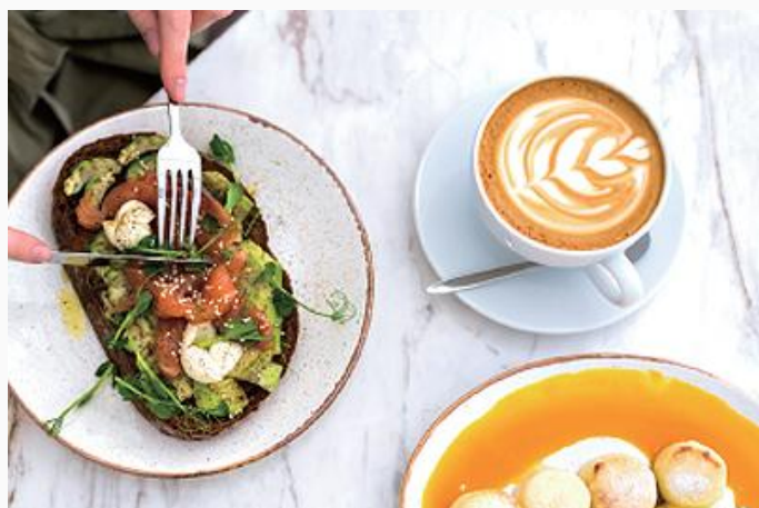
RMR(맛집 간편식) (Restaurant Meal Replacement)