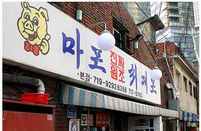
노포(老鋪, 옛날가게) 인기