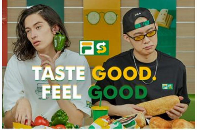
콜라보레이션 마케팅 (서브웨이-필라)