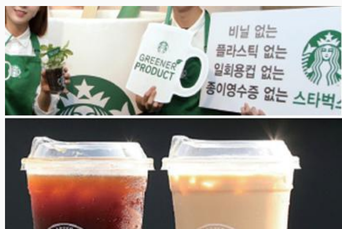
친환경 브랜딩, 제품 (기업의 사회적 가치 중시)