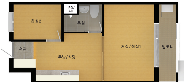
전용 36㎡ 148호