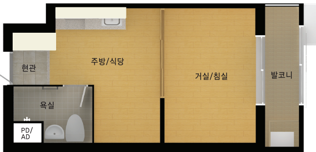
전용 26㎡A 122호