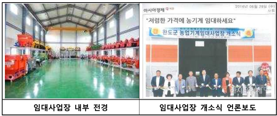
임대사업장 내부 전경