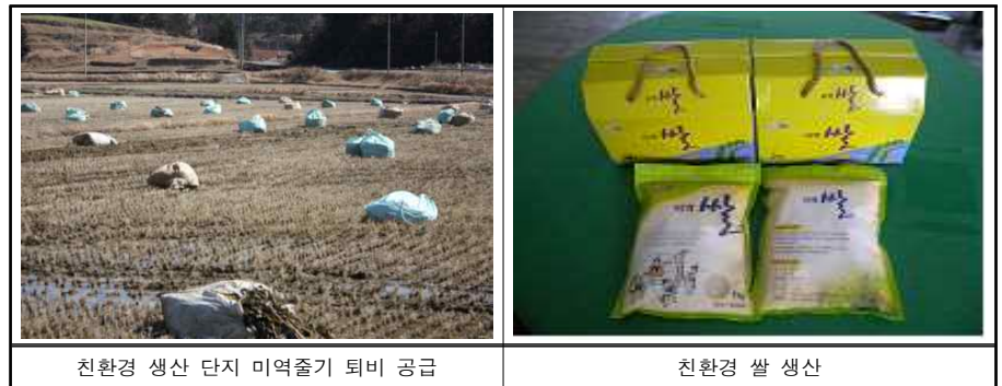
친환경 생산 단지 미역줄기 퇴비 공급