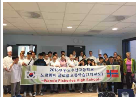
노르웨이 글로벌 교류학습(2016년)