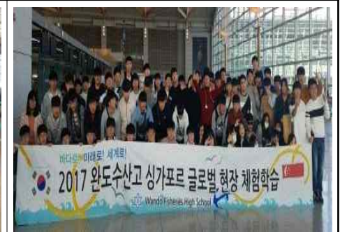
싱가포르 글로벌 현장학습(2017년)