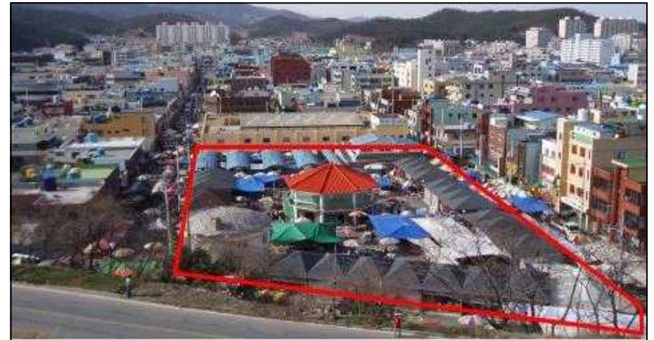
< 현 5일시장 전경 >