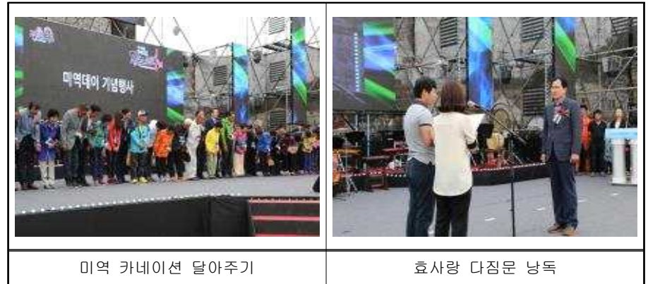
미역 카네이션 달아주기