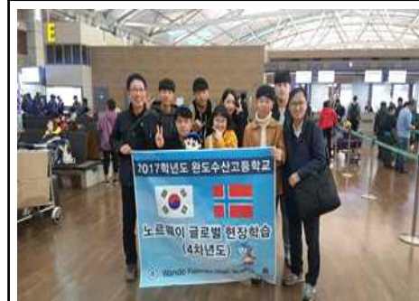
노르웨이 글로벌 현장학습 (2017년)