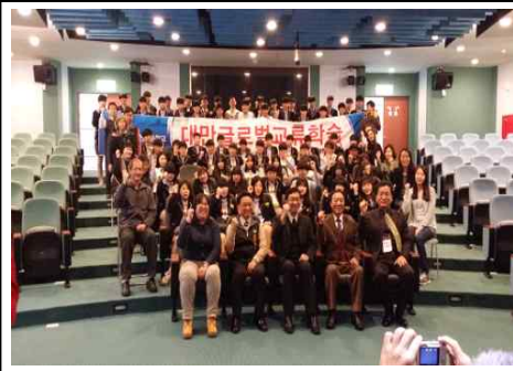
대만 글로벌 교류학습(2015년)