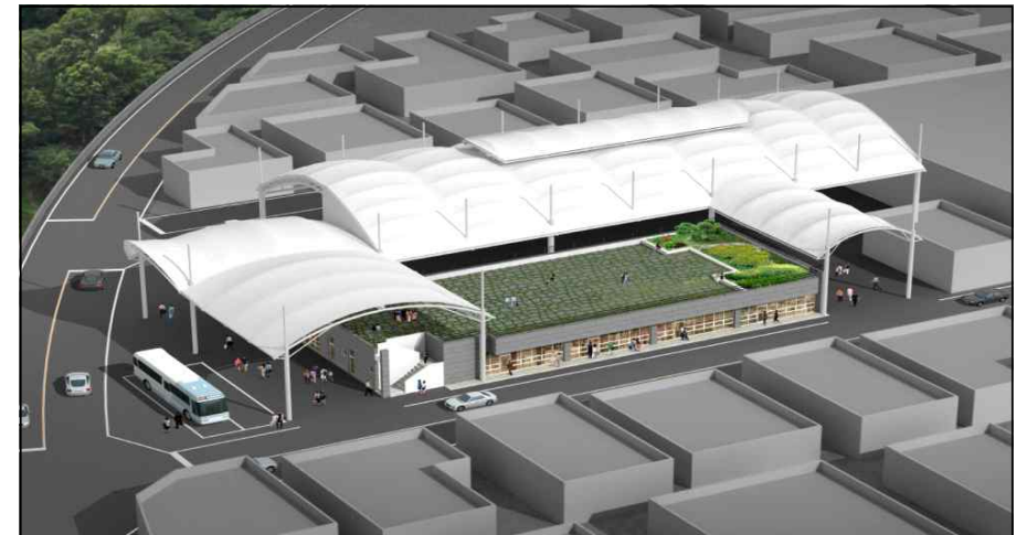
< 시설현대화 조감도 >