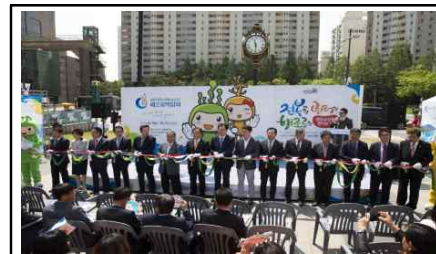
개장식 테이프 커팅