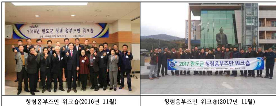
청렴옴부즈만 워크숍(2016년 11월)