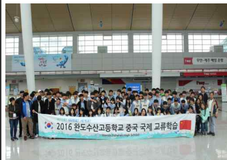
중국 국제 교류학습(2016년)