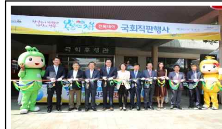
대한민국 국회 직판행사 커팅