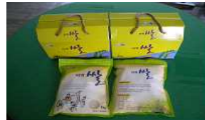
친환경 쌀 생산