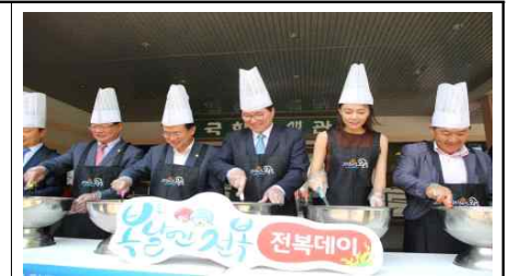
전복·해조류 물회 퍼포먼스

주관부서 경제산업과장 서길수 시장개척담당 조승호 담당자 김정삼(☎5572)