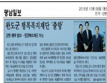
광남일보 외 14개사