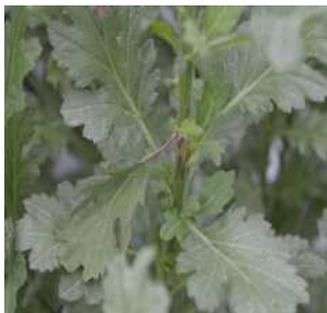
【줄기의 괴사 증상】