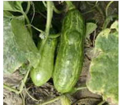
【호박 ZYMV 증상】

⇒ 진딧물 방제를 철저히 하고 작물이 시설 내에 연중 재배되어 항상 전염원은 있으므로 즙액에 의한 접촉전염을 막기 위해 병든 식물체는 즉시 제거