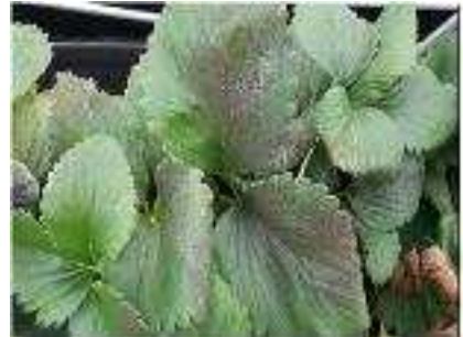
【온실가루이 그을음 피해】