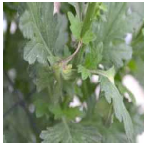
【잎자루의 괴사 증상】