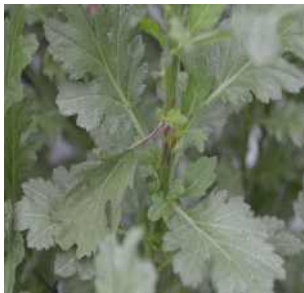
【줄기의 괴사 증상】

⇒ 적심 또는 절화 작업 시 바이러스 즙액 전염 억제용 가위를 사용하고, 발병된 포장이나 그 인근 포장에서 증식용 삼수 채취 금지