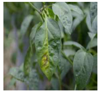
【국화 하우스 주변 고추 잎 괴사반점】