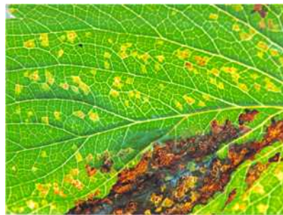
【후기 잎 증상】