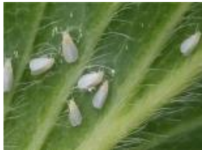
【온실가루이 성충과 알】