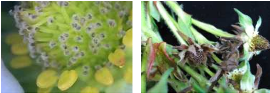
【딸기 꽃곰팡이병 증상】