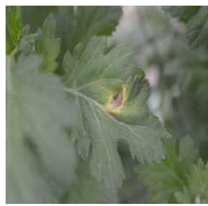
【잎의 괴사반점 증상】