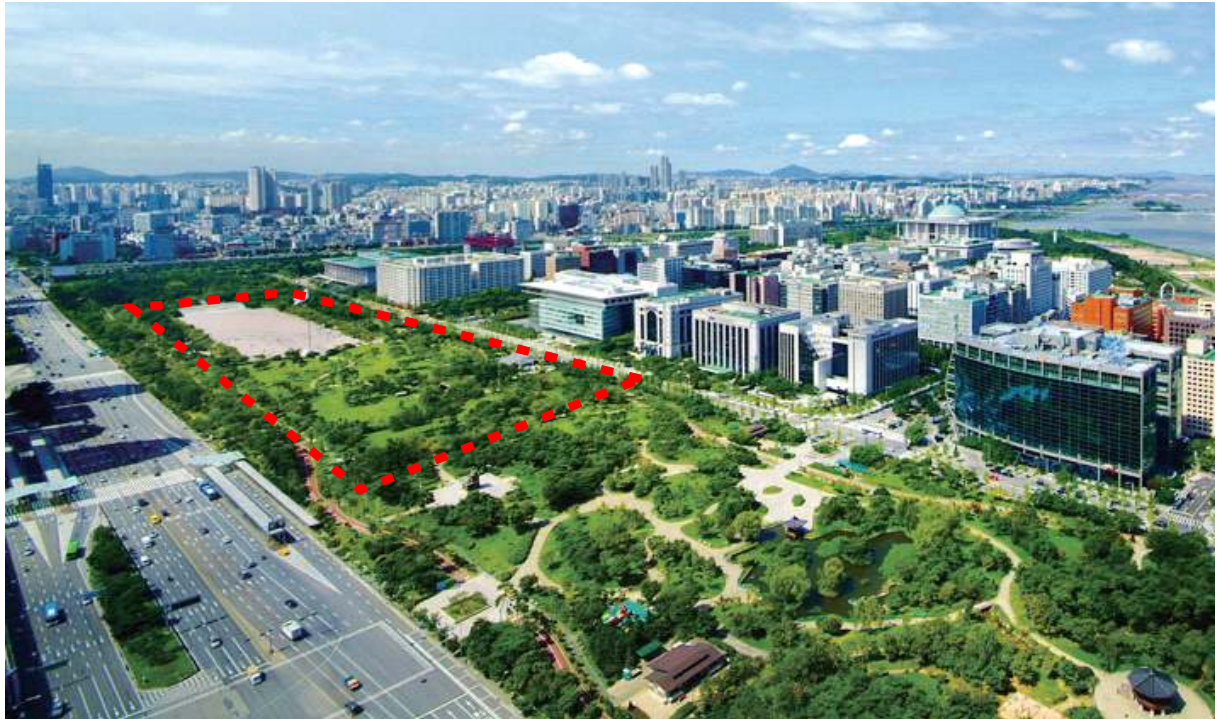
행사장 위치도(여의도 공원)