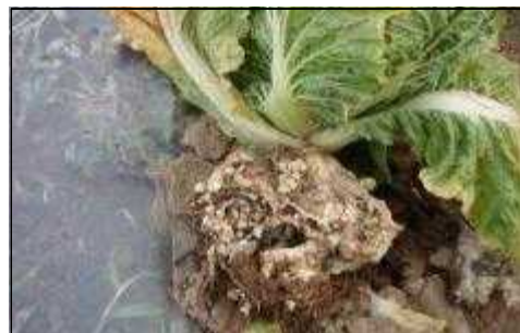
【배추 뿌리혹병 증상】