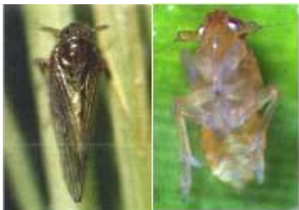
【벼멸구 성충(좌) 및 약충(우)】

⇒ 막대기로 벼 포기를 두들겨 나방이 나는 모습을 보거나 벼 잎이 세로로 말리는 유충 피해증상이 보이면 즉시 방제