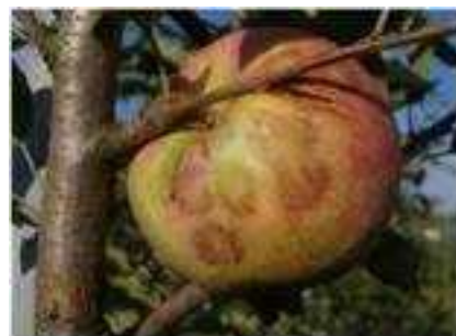
【노린재류 후기 피해 증상】