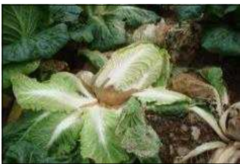
【배추 무름병 증상】

⇒ 병원균은 물이나 흙을 통하여 이동하므로 물 빠짐이 좋도록 배수로를 잘 정비하고 병 발생 후에는 방제가 어려우므로 병든 포기는 발견즉시 제거