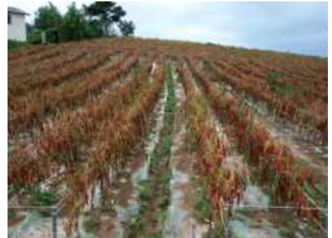
【고추 역병 증상】

⇒ 국가농작물병해충관리시스템 예측결과 비가 자주 내리기 시작한 6월 하순부터 국지적으로 감염위험경보가 발령되었기 때문에 향후 잦은 강우 시 확산 우려가 있음