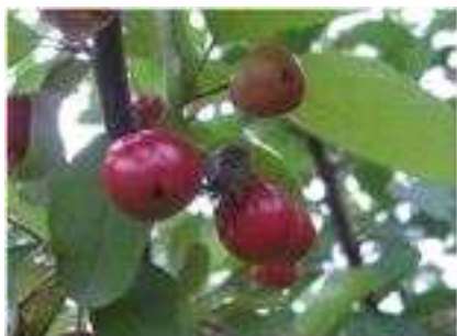
【썩덩나무노린재 꽃사과 기해】

⇒ 노린재류의 효과적인 방제를 위해서는 과원에서 발견되면 심식나방류와 동시에 방제 가능한 클로르피리포스 수화제, 비펜트린 수화제 등을 2~3회 골고루 살포