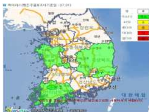
【고추 바이러스병 분포, 7월1일】