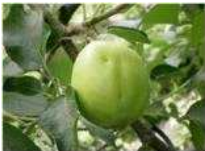
【노린재류 유과기 피해 증상】