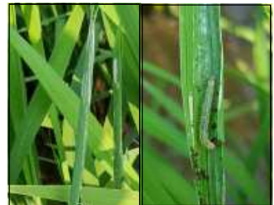
【흑명나방 피해(좌) 및 유충(우)】