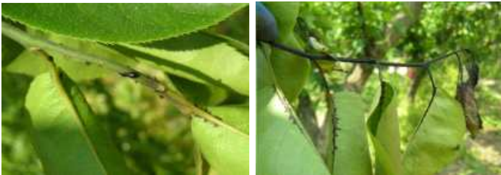
【배나무 가지의 화상병 병징】