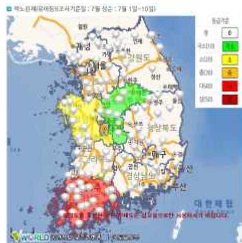
【먹노린재 발생분포, 7월 10일】