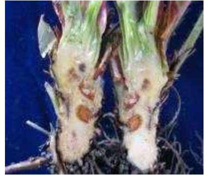
【작은뿌리파리와 탄저병 복합 증상】

가해하여 1~2소엽이 작아지거나 찢어지거나 기형이 되고 뿌리와 관부의 바깥부분부터 갈변하여 심할 경우 식물체가 고사됨. 딸기의 피해 증상은 탄저병이나 시들음병과 유사하여 구분하기 힘들고, 이들과 동시에 발생하여 진단이 어렵기 때문에 반드시