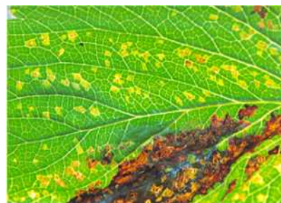
【후기 잎 증상】