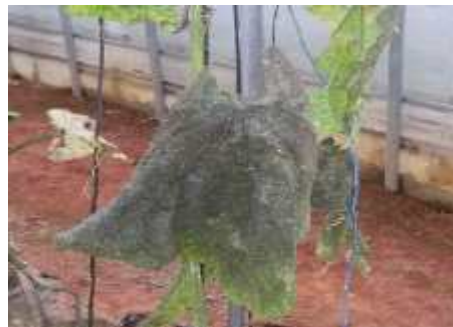
【진딧물에 의한 그을음병】

⇒ 이들 해충은 초기에 방제해야 효과적이므로 끈끈이트랩을 활용하여 주의 깊게 예찰하고, 발견 초기에 적용약제로 방제