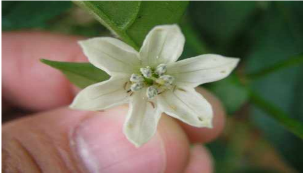
【꽃 주변 총채벌레 발생】

초기에 발생상황을 알지 못하여 피해를 입는 경우가 많고, 바이러스병을 전염시키는 매개충이기도 함