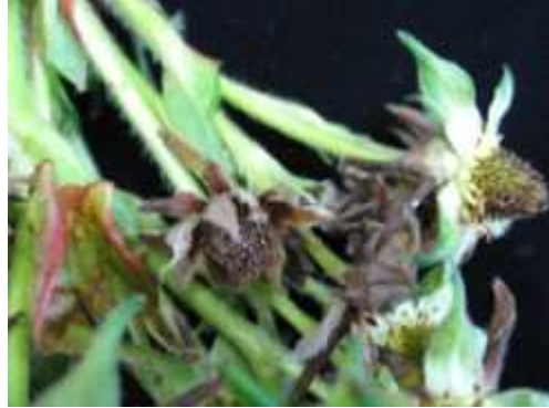
【딸기 꽃곰팡이병 증상】